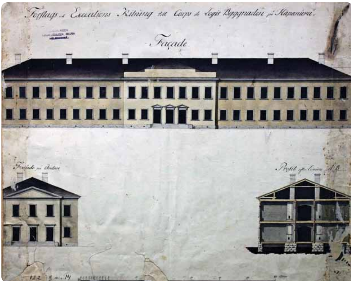
Haapaniemen sotakoulun päärakennuksen piirustukset.

Työhön ilmaantui kuitenkin odottamattomia vaikeuksia. Koska verollepanokartoituksilla oli kiire, maanmittareiden työstään saama palkkio säädettiin kannustavaksi. Tämä aiheutti sen, että komissionimaanmittarit käyttivät työssä runsaasti apputyövoimaa, jonka tiedot ja taidot eivät vastanneet heillä teetettyjä kartoitustöitä. Ylitirehtööri Wetterstedt totesikin, että työsaavutukset olivat yli nelinkertaiset aikaisempiin kartoituksiin verrattuina ja että valmiissa kartoissa oli runsaasti virheitä. Virheellisiä mittauksia oli erityisesti eteläisessä Savossa, jossa maanomistusolot olivat huomattavasti sekavammat kuin Kuopion ja Iisalmen pitäjissä. Valitettavasti pohjakarttoina käytettyjen veroluokituskarttojen virheet siirtyivät myös Sprengtportenin Savon kartastoon ja af Klerckerin myöhempiin valtakunnallisiin rekognosointikartoituksiin. Laajemmat alueet kattavat rekognosointikartoitukset voitiin nyt aloittaa ja ensimmäiset kartat valmistuivat jo 1777.