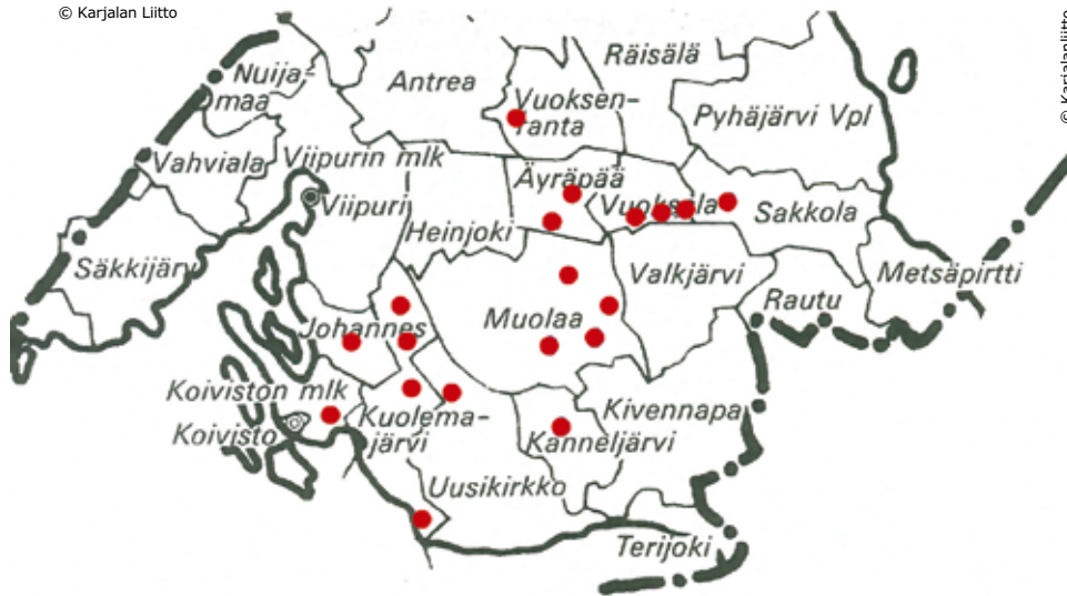
Kartta 2. Kannaksen tilusjärjestelyalueet.

pohjalta eduskunta sääti heinäkuussa 1942 lain tilusjärjestelyjen suorittamisesta eräissä osissa Viipurin lääninä. Sen mukaan tilusjärjestelyjä voitiin suorittaa ”tarkoituksenmukaisten jako-olojen aikaansaamiseksi niillä alueilla, joilla rakennukset ovat joko kokonaan tai suureksi osaksi tuhoutuneet”.