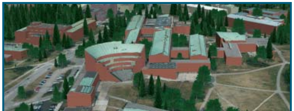
Terra-ohjelmistoilla tehty 3D-malli Otaniemestä käyttäen apuna laserkeilausta ja digitaalikuvia.