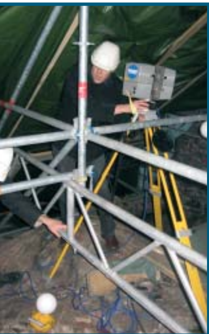
Maalaserkeilaus soveltuu vaativienkin rakennuskoh- teiden 3D-mallintamiseen.

Konferenssin ohjelma jakautui karkeasti neljään osaan: laseraineiston käsittelymenetelmät, metsäsovellukset, maalaserkeilaus ja sen sovellukset sekä eri laseraineistojen yhdistäminen keskenään ja digitaalisten kuvien kanssa. Konferenssin tieteellisesti mielenkiintoisinta antia olivat simulointiesitykset ja laserkeilauksen kalibrintipaneeli. Näissä kävi ilmi, että laserkeilaus tutkimuskohteena on jo kypsässä iässä. Perustutkimuksen lisäksi pääpaino siirtyy sovellusaloille lisäten perustutkimuksen määrää ja yritystoimintaa. Metsän tutkimukseen painottuva lisäarvopalvelu on selkeästi yritysten painopisteala, mikä näkyi sekä näyttelyssä että tutkimuspanoksena konferenssis- sa. Metsien inventoinnista on tu-