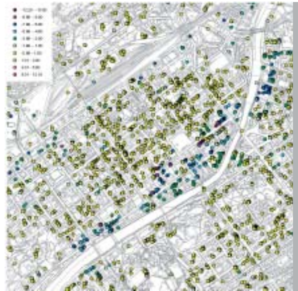
Kuva 3. Pysyviä sirottajia Turun keskustassa ja niiden liikenopeudet vertikaalisuunnassa.

Turun kaupungin kiinteistövirastolta on saatu referenssiaineistoja projektiin GL:lle ja TKK:lle. Lisäksi GL on suoritta-