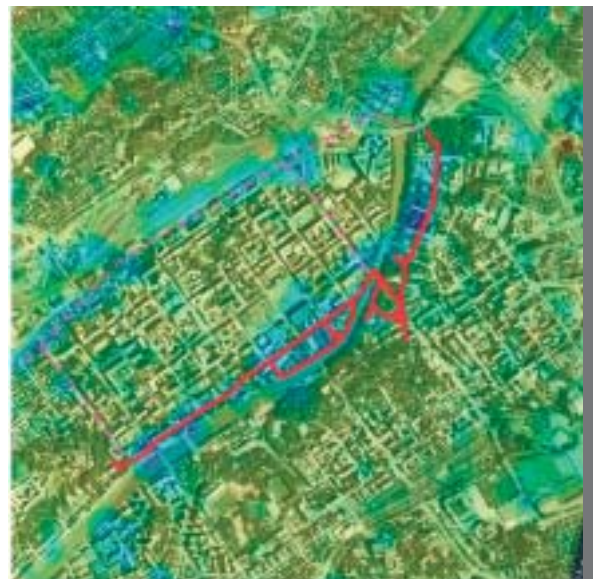
Kuva 4. PS-nopeuksista interpoloitu painumakartta. Kuvassa siniset alueet painuvat, keltaiset pysyvät paikallaan. Punaisella on merkitty GL:n toteutettu tarkkavaaitusreitti.

nut omia tarkkavaaituksia Turussa. Kaikki mitatut vaaituspisteet ovat kalliopisteitä tai rakennusten sokkeleissa olevia korkopultteja/tappeja. Kalliopisteiden oletetaan muuttuvan tasaisesti samaan tahtiin. Testialue on myös pieni, joten suuria eroja kalliopisteiden välillä ei oletettavasti ole. Vaaitustulokset ja SAR-kuvilta mitatut vajoamisnopeudet ovat sopineet hyvin yhteen.