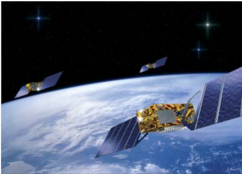
Galileo-järjestelmän satelliitteja on tämän vuosikymmen loppuun mennessä kiertoradalla 30 kappaletta.