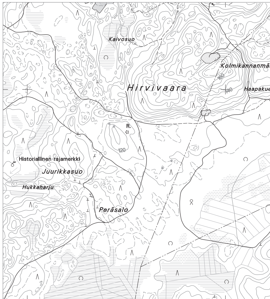
Punkaharjun Hirvivaara sijaitsee maastokartan lehdellä 4124 05 lähellä kolmen kunnan, Kesälahden, Punkaharjun ja Saaren yhteistä rajapyykkiä. Tässä on siis nykyisin Itä-Suomen ja Etelä-Suomen läänien välinen lääninraja. Ennen paikka edusti toisaalta savolaisten ja karjalaisten välistä heimorajaa, toisaalta Ruotsin ja Venäjän välistä valtionrajaa.