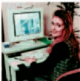
Digital Image Analytical Plotter