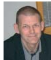
Skrivbenten är utvecklingschef på inskrivningsmyndigheten Lantmäteriet, divisionen för inskrivningsfrågor. Han har under drygt tio år

respektive inskrivningskontor. Det är inte osannolikt att överlåtelsehandlingar som köpekontrakt och köpebrev kan upprättas i digital form direkt istället för att först behöva upprättas på papper för att skannas till elektroniskt överförbart format. Likaså kan de återstående papperspantbrevens upphöra att gälla till förmån för den elektroniska varianten som i huvudsak hanteras redan idag.