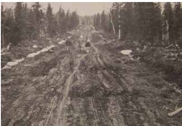
Asutustiet rakennettiin aluksi kiireellä kevytrakenteisiksi. Kelirikkoaikana näky oli ankea.

Maanlunastuslautakuntaan kuului puheenjohtaja, joka oli maanmittausinsinööri, sekä jäsenenä agronomi, metsänhoitaja sekä yksi maansaajien ja yksi maanluovuttajien edustaja. Sallassa agronomijäsenenä toimi maatalousteknikko ja metsänhoitajajäsenenä metsäteknikko. Lautakunta toimi tuomarin vastuulla, eivätkä valitut voineet lain mukaan kieltäytyä tehtävistä.