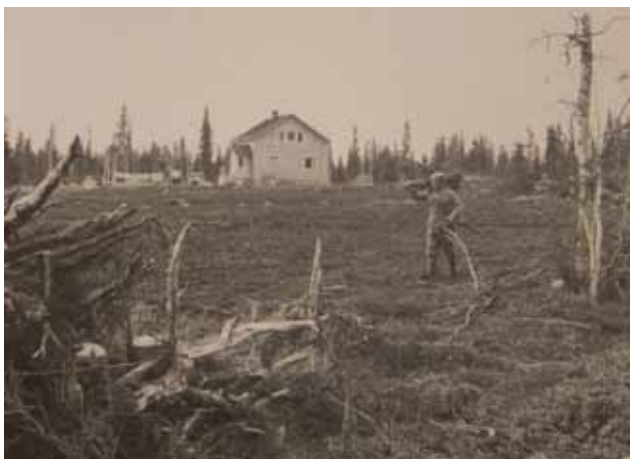
Raivatulta tilalta kertyneet juurakot kasataan. Kasa tuikattiin lopulta tuleen ja kitkerä savu leijaili roviolla.