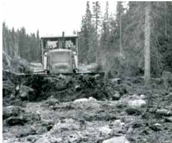
Sallan sota- ja jälleerakennusajan museo