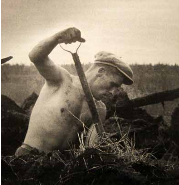
Suo, lapio ja rintamamies. Valtion suorittaman peruskuivatuksen jälkeen jäi myös tilan rakentajalle yllin kyllin ojankaivuuta.