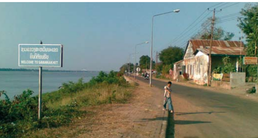
Testialue sijaitsevat Savannakhetissa Mekong-joen varrella 400 km Vientianesta.

Kuten tropiikissa aina, hankkeen toteuttamisajankohdan määritteli kuivan kauden ajoittuminen. Laosin tapauksessa otollinen aika oli marraskuusta helmikuun loppuun. Valmistelut pääsivät kiireellisestä tilauksesta johtuen kunnolla käyntiin vasta joulukuussa. Tiesimme, että maaliskuusta alkaen ovat sopivat lentokelit vähenemään päin, eikä toteutusta voitu paljoo siirtää. Keilattavan alueen pinta-ala ei sinänsä ollut kovinkaan suuri. Koska tarkoituksena oli ottaa alueelta myös ilmakuvat, riitti päivittäisiin lentoihin sopivissa valaistusolosuhteissa aikaa noin 6 tuntia. Tällä kaavalla laskettuna piti koko alueen olla keilattuna kahdessa päivässä.