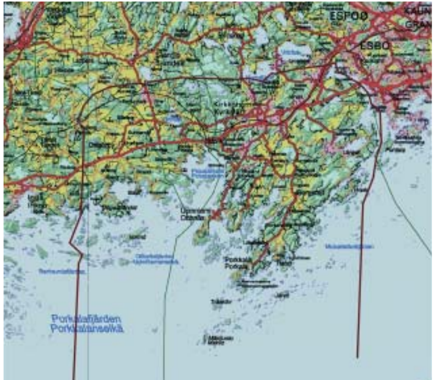
Porkkalan vuokra-alueen rajat, mittakaava 1:250 000.