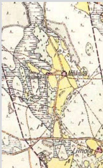
Pitäjänkartan 1:20 000 karttanäyte vuodelta 1929.

MÄKELÄSSÄ ON OLLUT VUONNA 1788 RAIVATTUNA PELTOJA JA NIITTYJÄ LÄHES SAMA MÄÄRÄ KUIN PITÄJÄNKARTASSA JA PERUSKARTASSA!