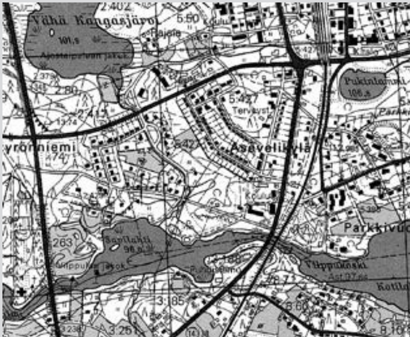
Yksivärinen karttanäyte on valokuvattu Vilppulan asemaseudun viisivärisestä peruskartasta 1:20 000 vuodelta 1976 (karttalehti nro 2231 08).

EDELLEEN VOIDAAN TODETAA, ETTÄ VÄHÄ KANGASJÄRVEN JA SAVILAHDEN VÄLTIEN KIINTEISTÖRAJA, JOKA PÄÄTTYY RAJAPYYKKIIN ÄIJÄNPÄJY , ON NÄHTÄVISSÄ KUMMASSAKIN KARTASSA. EDELLEEN KARTAN ITÄOSASSA OLEVA PARKKIVUOREN KALLIO ON KUVATTU ISOJAKOKARTASSA KUVIONA 245.