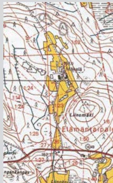
Peruskartan 1:20 000 karttanäyte vuodelta 1976.

KIHLAKUNNAN KARTASSA ON RUOVEDEN KIHLAKUNTAAN KUULUNUT OSA VILPPULAA. TÄMÄ ALUE ON NYKYISIN OSA VUONNA 1986 LAAJENTUNUTTA VILPPULAA.