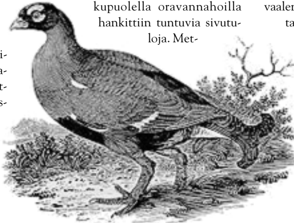
Piirros: Thomas Bewick, Teeri (n. 1797).

Vähitellen myös maaperä alkoi antaa elantoa Suomenmaalla. Kaskiviljelys valtasit alaa, karjaakin hankittiin. Tervan merkitys talouden tukijana oli huomattava, etenkin 1600-luvulla. Mutta kauan säilyi eränkäynti merkittävänä leivän jatkkeena. Vielä niinkin myöhään kuin 1940-luvulla ja 1950-luvun alkupuolella oravannahoilla hankittiin tuntuja sivutu- loja. Met-