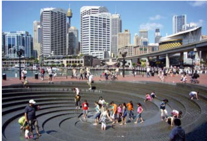
FIG:n kongressi Sydneyssä 11.–16. huhtikuuta MAANMITTARIT MATKALLA "DOWNUNDER"

FIG:N TOIMINTA on vuosi vuodelta laajentunut ja kongressin nyt palatessa toista kertaa "downunder" tulee osanottajamäärä lähes kaksinkertaistumaan edellisestä Melbournen kongressista. Vuonna 1994 Australiassa Suomen lippu liehui korkeimmillaan, sillä olihan Melbourne heti Suomen hallinnon jälkeen. Nyt ollaan tilanteessa, jossa kongressi on täysin FIG:n hallinnosta riippumaton. Tämä on tarjonnut samalla sekä paljon uusia mahdollisuuksia että monia haasteita.