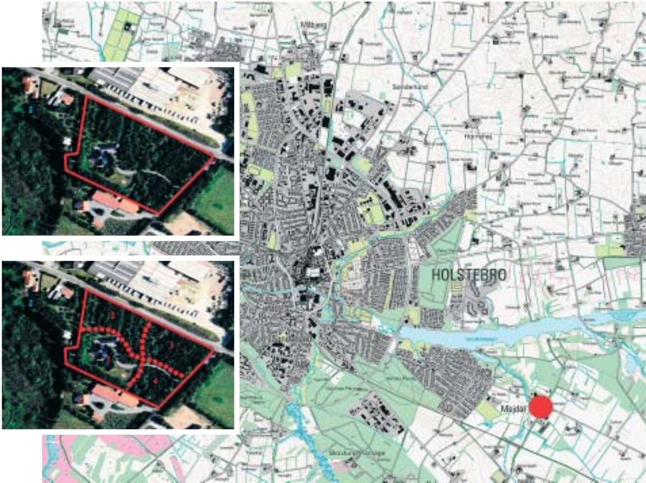
Esimerkkialueen sijainti, ortokuva kiinteistön alueesta sekä ehdotus rakennuspaikkajaaksi.